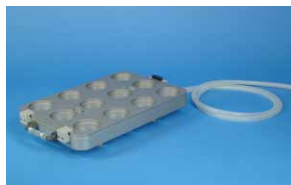
⑥12本用フラッシュバックモジュール