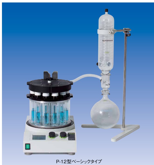
P-12型ベーシックタイプ