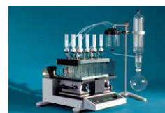
SPEアドバンス使用例