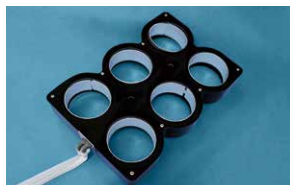
⑤6本用フラッシュバックモジュール