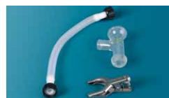
⑥エバポ接続部品セット