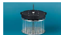
②エバポレーションユニット