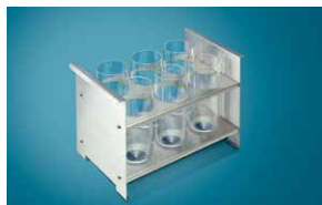
①ガラス容器スタンド