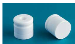
①ブラインドアダプター