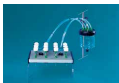
⑦ SPEアドバンスカバータイプ

三方ストップコックのないシンプルな構成で、SPEカートリッジからの液は全てシンコアの濃縮用容器へ吸引されます。