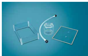
②ラック用断熱材セット(高沸点溶媒用)