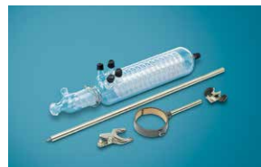
④コンデンサーセットS型 受けフラスコ付