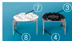
③⑦移動用ラック ④⑧準備用ラック