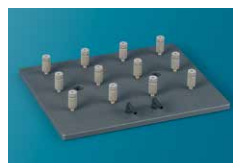
⑧ SPEベーシックモジュールタイプ