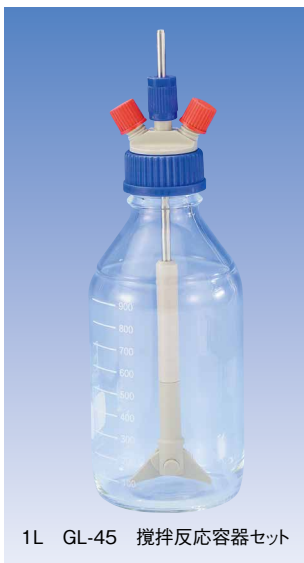
1L GL-45 攪拌反応容器セット