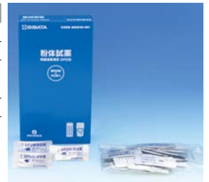
粉体試薬 DPD 法用 （100 回分）