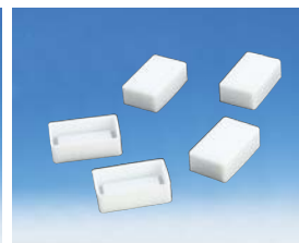
シリコンキャップ （角形試験管用）