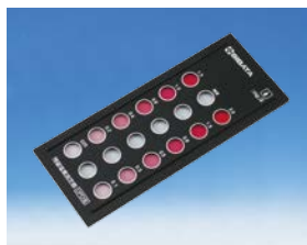
樹脂比色板 DPD 法用