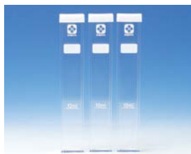
角形試験管 シリコンキャップ付