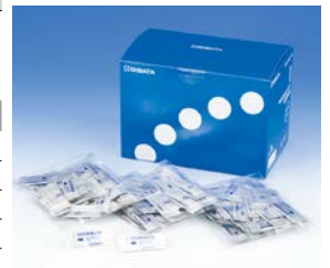
粉体試薬 DPD 法 徳用 （500 回分）