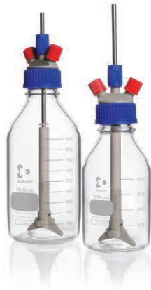
攪拌反応容器セット