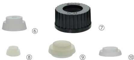
ねじ口キャップ (穴付) シリコンパッキン