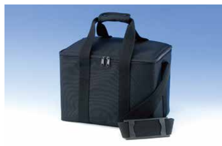
ソフトケース OFD-1型用