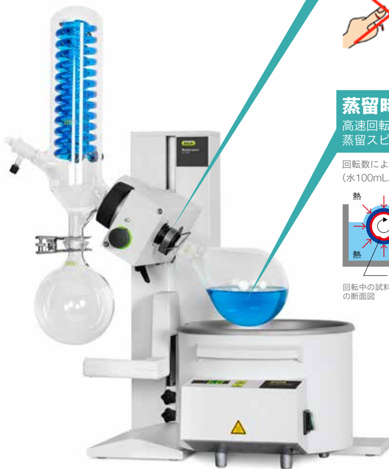
ロータリーエバポレーター R-100