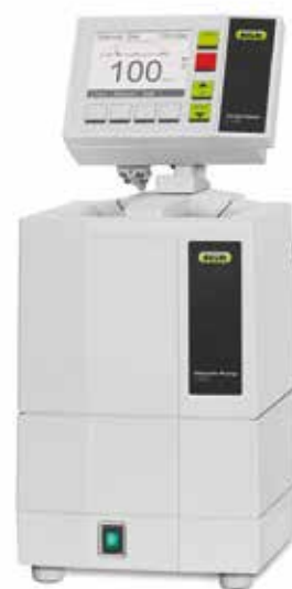
ダイヤモンド真空ポンプ インターフェースセット V-102