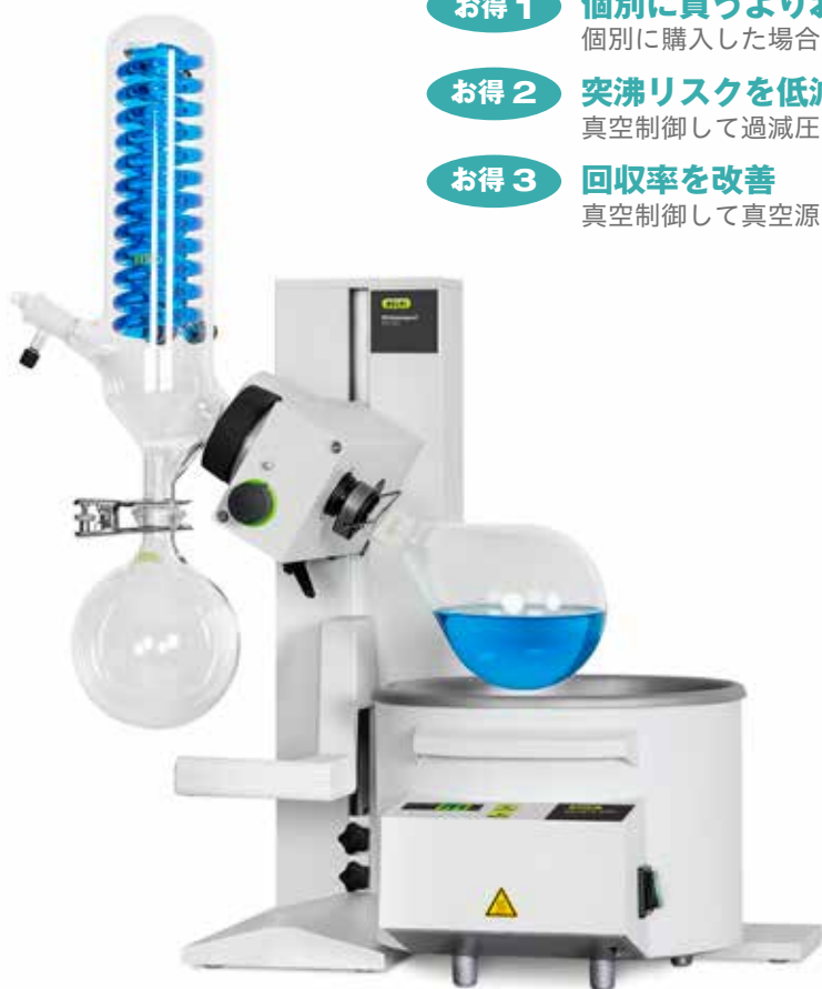
ロータリーエバポレーター R-100